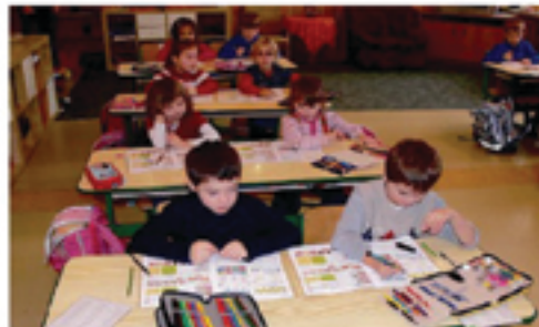
MALÝ KOLEKTIV. Výuka v malém kolektivu s sebou nese řadu výhod. Děti se už od začátku mohou komunikovat s učitelem, který má dost času na všechny otázky i odpovědi.

Výhledy z této plynou především z učitelů. Učitelé tak má na zájmy více času, takže se mohou hodiny každému individuálně více věnovat, upozornit na chyby nebo pochválit, kde se daří,“ uvádí ředitel. Na druhou stranu se ale žáci nemají kam schovat. „Šest dětí