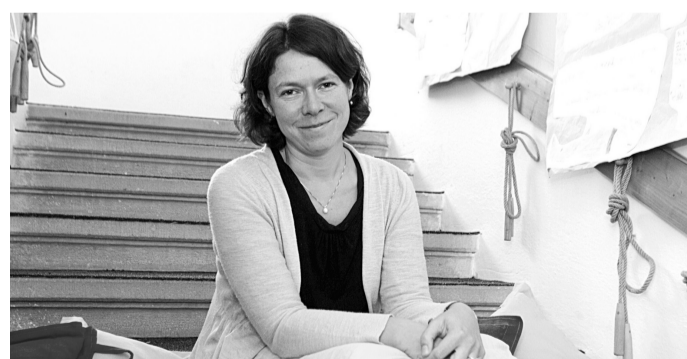
JAKO DOMA. Škola v Babicích nad Svitavou sází na praktické znalosti.

Dětem se tento způsob výuky líbí. Jejich zážitky mohou