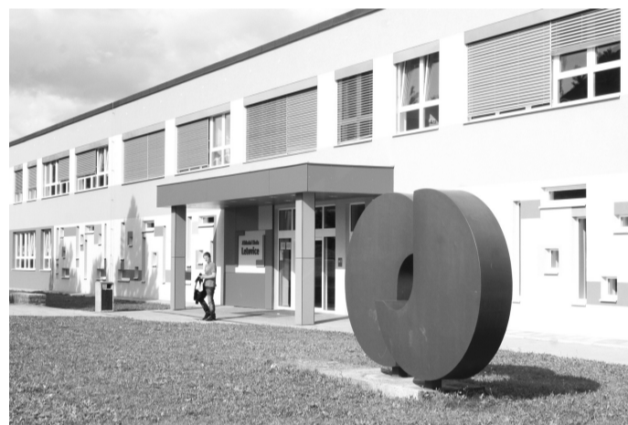
MOUDROST V OPAKOVÁNÍ. Letovická škola je na žáky přísná.

Máme špičkově zrekonstruovanou školu a výborně vybavené učebny. Také jsme vydrancovali peníze, kde se dalo. (úsměv) Ale základ je v kvalitě výuky. Navíc vzdělání poskytujeme jak žákům mimořádně nadaným, tak i těm méně šikovným. Napří-